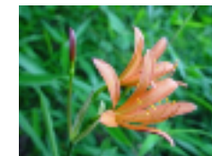
キツネノカミソリ