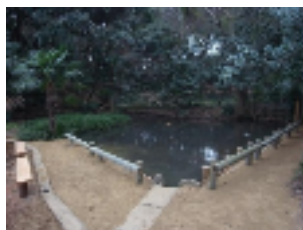
整備後の遊水池の様子