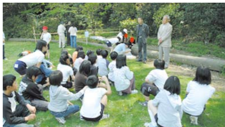
ホタルの放流の説明会