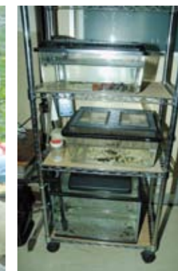
ホタルの幼虫の飼育