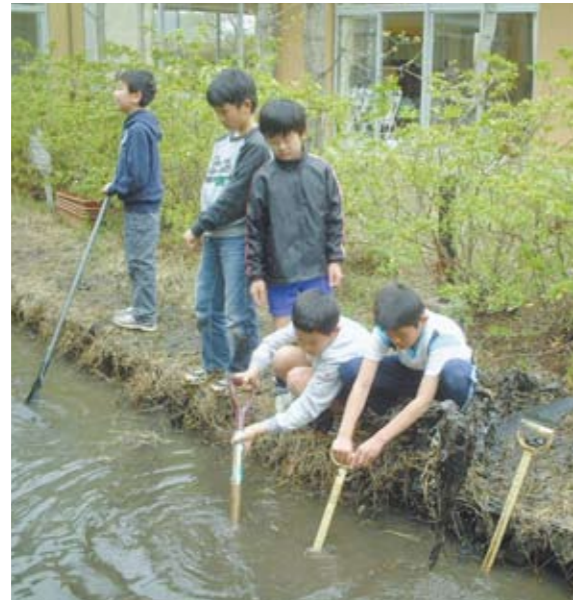
ビオトープの清掃