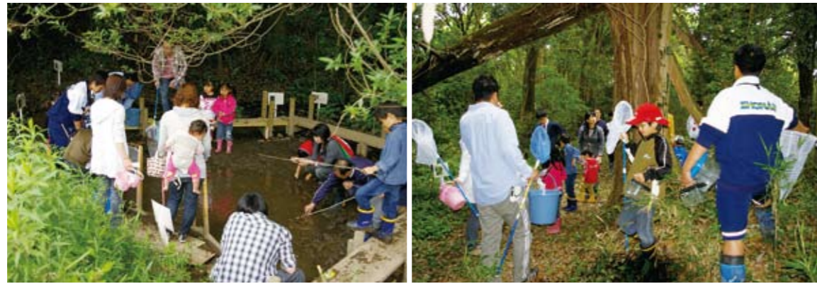
地域の住民を招いての観察会