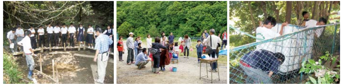
中学生体験入学のようす