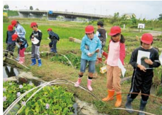
自然観察会の様子