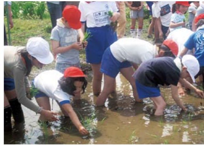
ビオトープでの田植えと稲刈り