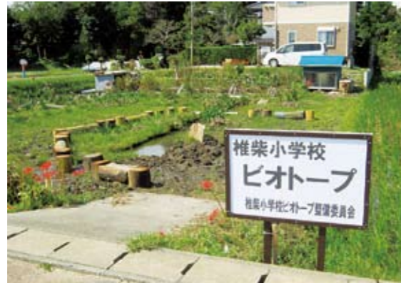
椎柴小学校ビオトープの全景