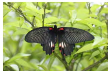
ナガサキアゲハ

地球温暖化による気候の変化（気温・降水量などの異常気象）は、生物が対応して分布を変える速度よりも速い速度で起こっていると考えられています。移動速度の遅い生物への影響は特に大きく、多くの生物種への影響とともに、生態系バランスが大きく崩れてしまう危険性があります。