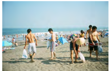
海岸清掃の様子

九十九里浜は、北は旭市の刑部岬から南はいすみ市の太東岬まで50キロメートル以上にわたる長大な砂浜です。海底がゆっくりと隆起して、そこに太平洋の潮流と荒波が砂を運び、陸地化した地域です。ここではハマヒルガオなど砂浜に特有の生物がくらすなど、特異な生態系が形成されています。また、後背地は低地が続き、湿地や沼が点在していて、天然記念物の指定を受けた食虫植物群落もあります。