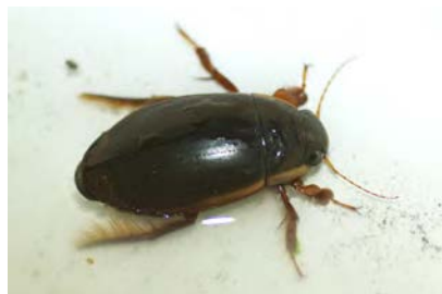
シャープゲンゴロウモドキ

千葉県レッドデータブックは、1998 年度に植物編、1999 年度に動物編が発行されました。その後、定期的にレッドリストやレッドデータブックの改訂が行われています。これまでに 1866 種（2009 年時点）の動植物が選定されています。