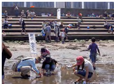
クリーンアップ後の三番瀬観察会

東京湾の三番瀬は、川からの土砂や栄養分を含んだ淡水が流れ込むことによつてつくられた広大な干潟や浅海域です。そこには鳥類、魚類など多くの生物が生息し、江戸時代から豊饒の海といわれてきました。しかし、戦後の大規模な埋め立てや都市化により、自然環境の悪化や生態系の変化が生じてきています。