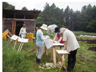
「はらっぱ保全のため立ち入り禁止」の看板製作

一方、この地域は、住宅・都市開発の進展や廃棄物の不法投棄により、自然環境の悪化も見られます。そこで、大学の研究者や地元で活動している多くのNPOが結集し、北総里山クラブが発足し、地域の保全再生にむけた様々な活動が行われています。