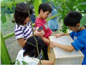
オオムラサキの観察

水上小学校は、なだらかな房総丘陵に囲まれ、水田や畑、雑木林がみられる自然豊かな環境にあります。しかし、学区にある山間部の水田は、急速に放棄が進み、雑木林も荒廃が徐々に進んできています。また、子ども達もこの豊かな自然に目を向けることは少なく、身近な自然に直接ふれる機会が不足しているという状況も生じてきています。