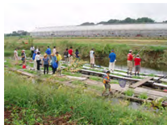
外来種防除のための「バス釣り大会」（NPO 法人とんぼエコオフィス、NPO 法人印旛野菜いかだの会、NPO 法人千葉県障害者就労事業振興センター）

そこで、2004年、住民と行政が一体となって「印旛沼流域水循環健全化緊急行動計画」を策定し、湧水の復活や生活排水対策、環境教育などの対策を進めています。この対策は計画の目標達成状況などを確認しながら進める「みためし行動」という方法がとられています。あわせて、市民グループやNPOによる印旛沼の再生に向けた様々な活動が行われています。