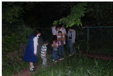
地域の方々を招いてのホタル鑑賞会

このヨシ原湿地を生物多様性保全と教育活動に活用する場にするため、生徒と職員で、隣接する斜面林の湧水を活用して水が流れるようにしたり、外来植物を駆除したり、観察用の木道や東屋などを整備してきました。今では、メダカ、クロアゲハ、ショウジョウトンボ、ニホンアカガエル、カナヘビなど多くの生物を観察できるようになりました。学校だけでは難しかったビオトープの維持・管理は地域の方々の協力により実施され、良好な環境が保たれています。また、ビオトープで復活させたホタルの鑑賞会は、地域の方々や老人福祉施設のお年寄りに大変好評です。