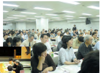
ちば生物多様性県民会議

千葉県では、専門家だけでなく、多くの県民の方が参加して議論を行い、2008 年 3 月に全国初となる「生物多様性ちば県戦略」を策定しました。県戦略では「生命の いのち つながりを子どもたちの未来へ」を理念とし、50 年後を目標に、生命のつながりを育む社会、資源循環型の持続可能な社会、豊かな自然と文化を守り伝える社会を目指し、県が行う具体的な取り組みについて示されています。