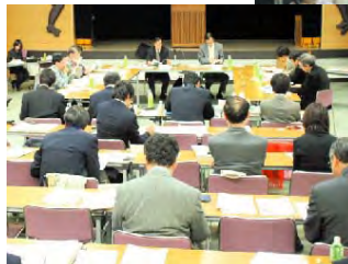
生物多様性ちば県戦略専門委員会