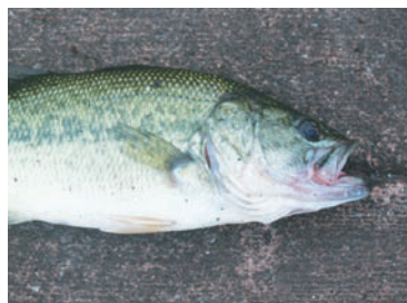
オオクチバス【特定外来生物】