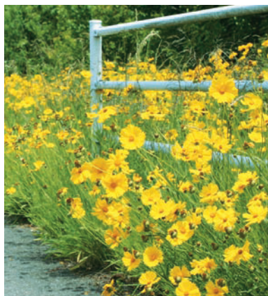
オオキンケイギク【特定外来生物】