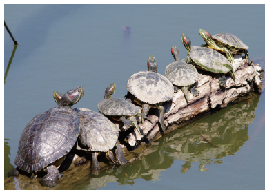
ミシシippアカミミガメ【緊急対策外来種】