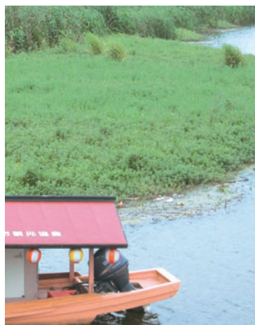
ナガエツルノゲイトウ【特定外来生物】