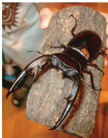
マンディブラリスフタマタクワガタ