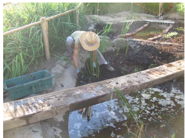
【地域住民が協力したビオトープの維持管理】