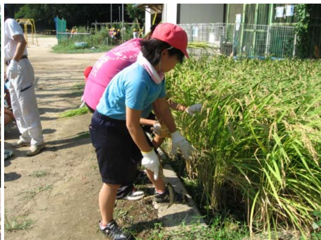
【ビオトープにある田んぼで児童による稲刈り】