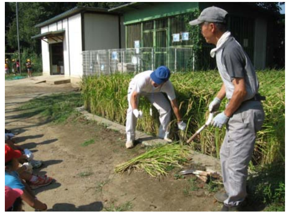
【地域の方と一緒に収穫をするようす】