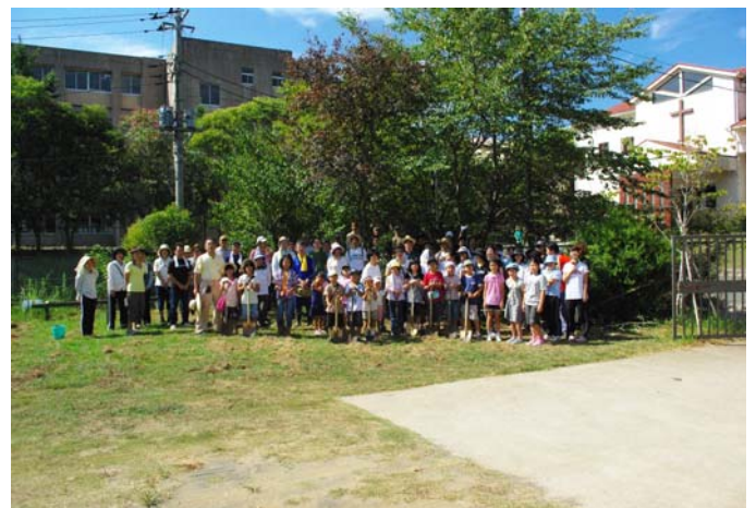
【ビオトープ予定地で作業開始前に記念写真】