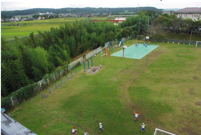
【屋上より養老川と水田地帯の眺望】