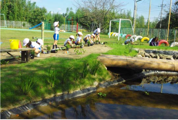
【1年生による植樹と生け垣作り】