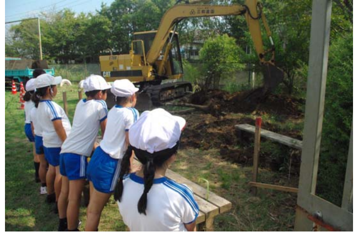
【池掘り作業を見学】