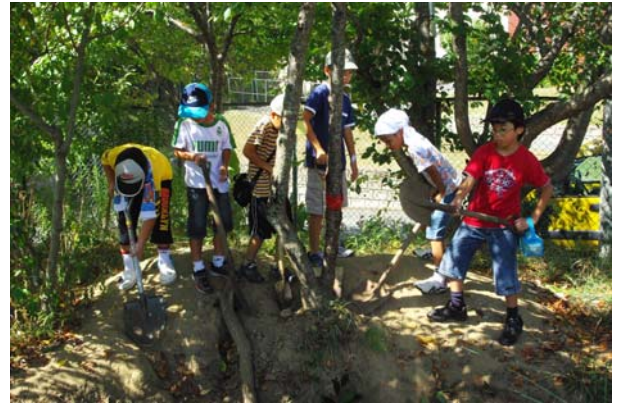
【児童による敷地内の樹木の移設】