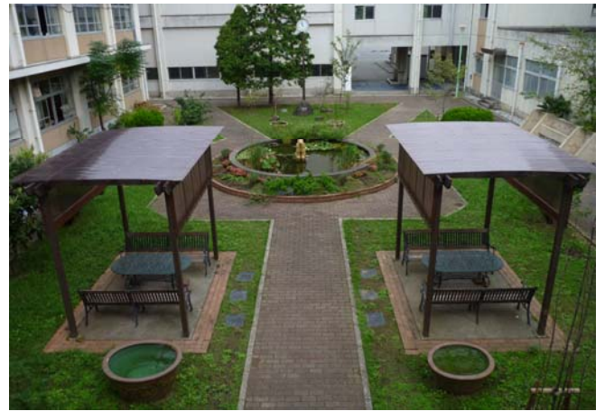
【ビオトープ（中庭部分）の全景】