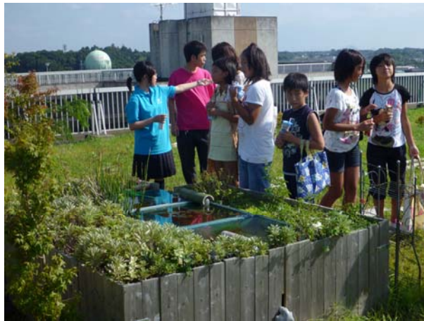
【生徒による近隣小学生対象の観察会】