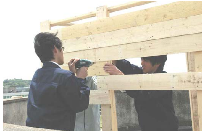
【野鳥観察小屋の製作】