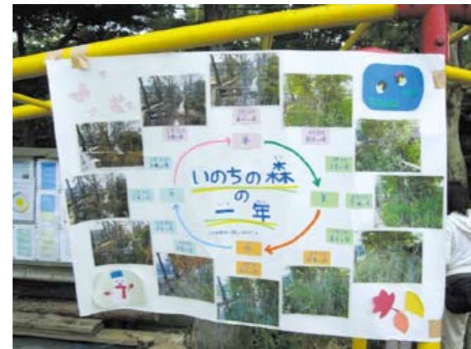
いのちの森の一年(季節を感じる・一年の変化を振り返る)