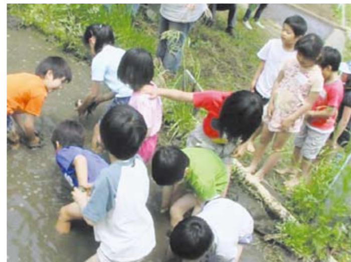
水田の代掻き(宝探し)

アマガエルを呼びたい。 4年前にオニヤンマが羽化したことがあるので、小川をもう少し開放的にして毎年見られるようにしたい。