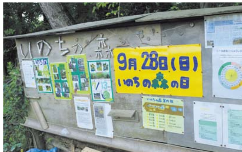
いのちの森の案内板