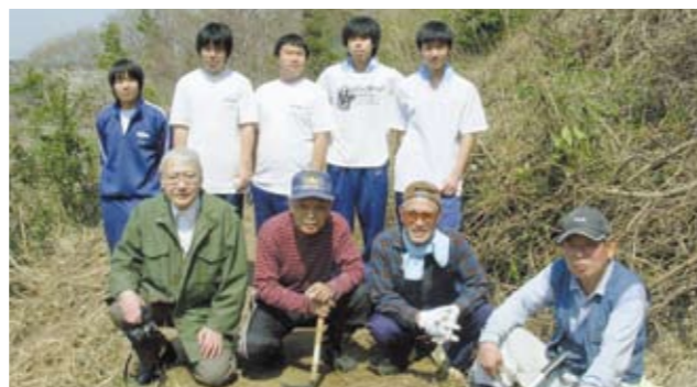
まちづくり協議会の皆さんと斜面林の整備