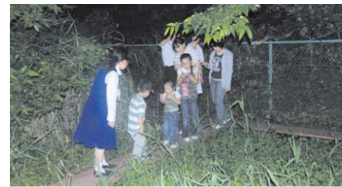
ホタル観賞の夕べ