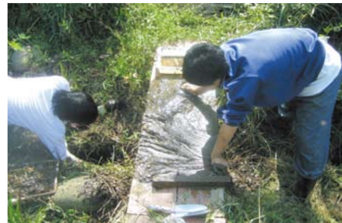
オニヤンマのヤゴ調査

千葉県高等学校教育研究会理科部会生物分科会の中に、「船橋地区研修会」「ビオトープ研究班」というグループがあり、それぞれ本校のビオトープについて関心を持っており、今までに数回