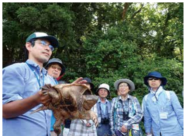
カミツキガメを解説するセンター職員