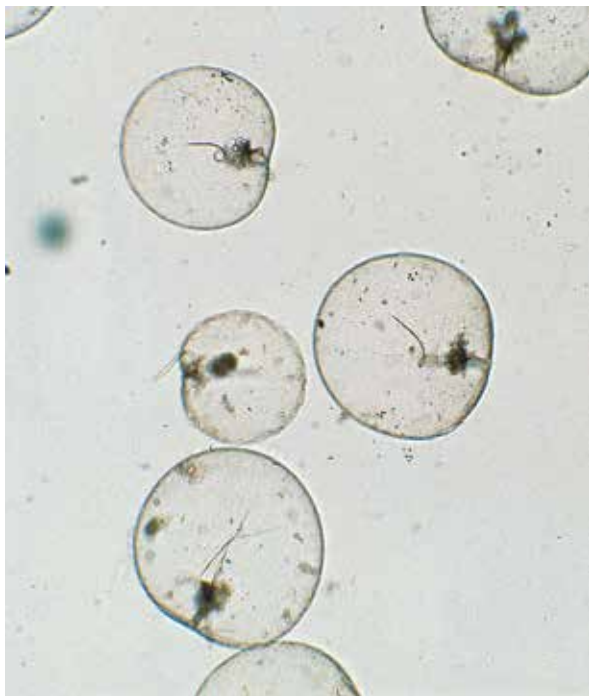
図2：真っ赤な色の原因、ヤコウチュウ（夜光虫） Noctiluca scintillans (Macartney) Kofoid & Swezy 1921は渦鞭毛植物のヤコウチュウ科ヤコウチュウ属のプランクトン。大きいもので直径1~2mm程です。

赤い色の正体は、「赤潮」と呼ばれる、プランクトンの異常増殖による現象です。色味は増殖したプランクトンの種類によって決まり、表紙の写真のようにまるでペイントを流したかのような鮮烈な赤いものは、ヤコウチュウ（夜光虫）による場合が多いようです。多くの方が「赤潮」と聞くとこのような画を思い浮かべます。原因は夜光虫ですので、夜間には発光現象が見られるなど、唯一「見に行きたい」赤潮かもしれません。