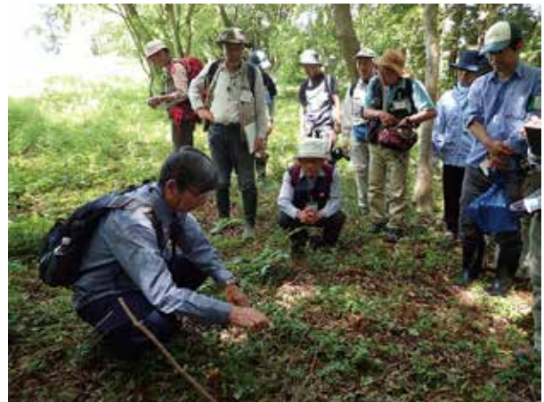
原講師による植物の解説