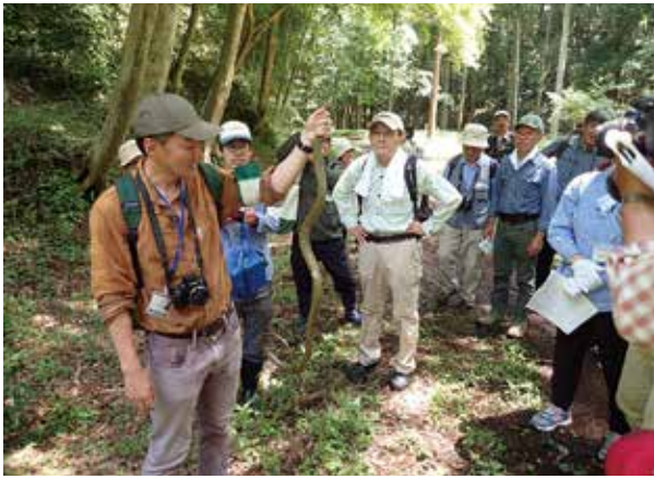
アオダイショウを捕獲