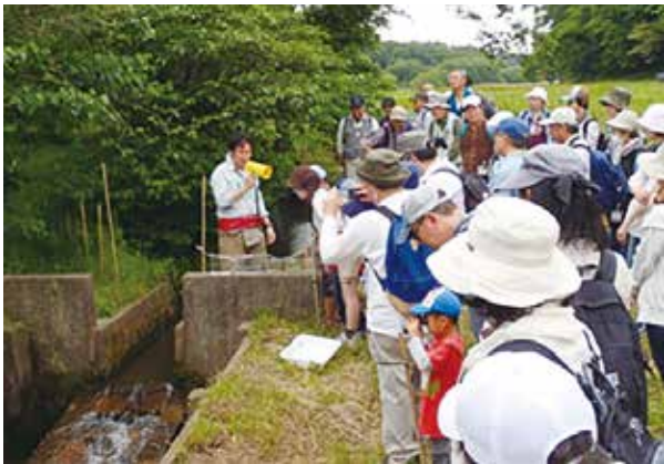
水辺の生き物を解説するセンター職員