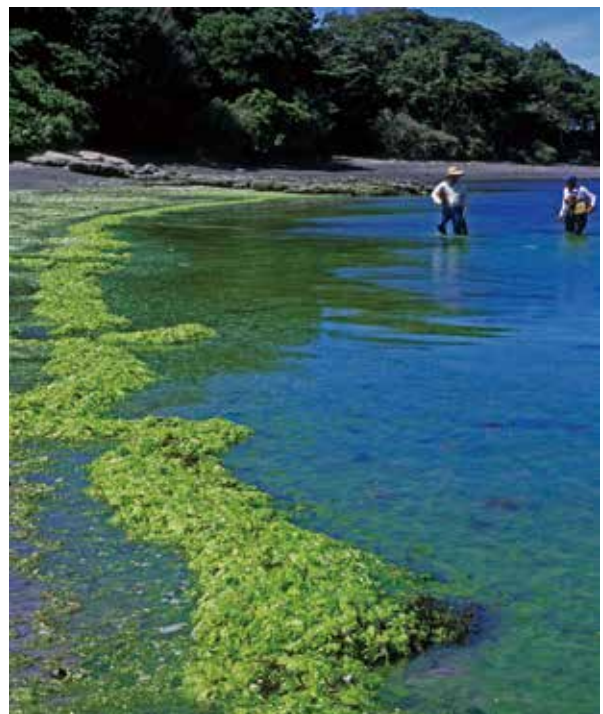
図3：緑色の藻類が異常増殖したのもも赤潮 館山湾沖ノ島 2010.7.18

赤潮の定義にはほかに、1 ml 中のプランクトンの数で判断する場合もあります。具体的な数は種によって異なりますが、種類によっては水面を横から眺めてうっすらと赤く見えるものや、見た目はミドリ色をしたアオコなども赤潮の一種なのです。そう、赤潮ってダム湖など淡水でも起こるんです。日本ではこのような淡水赤潮を water-bloom（水の華）などと呼んでいます。きれいな呼び方をしても、中身は赤潮なんですけどね。