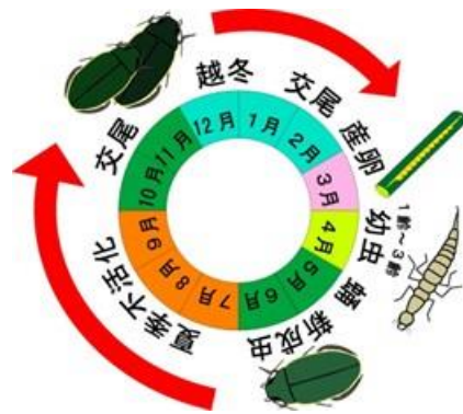
図2. シャープゲンゴロウモドキの生活史