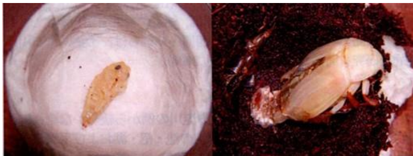
図5. 蛹（左）と羽化個体（右）。