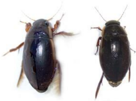
図1. シャープゲンゴロウモドキの成虫。左：オス、右：メス